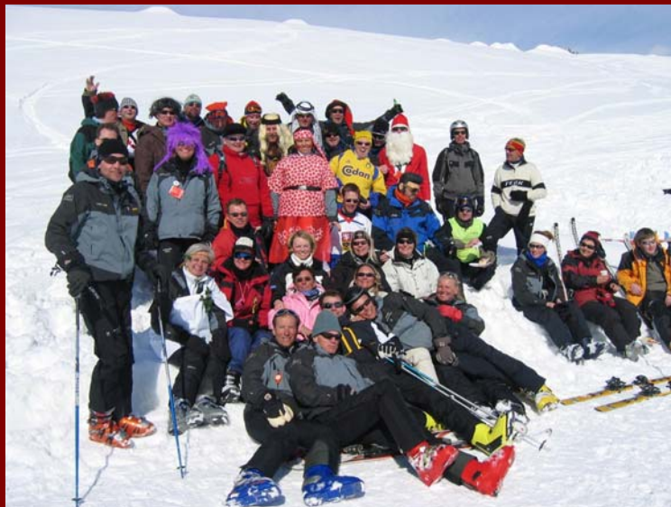
Skihajer i sneen / Val d'Isere